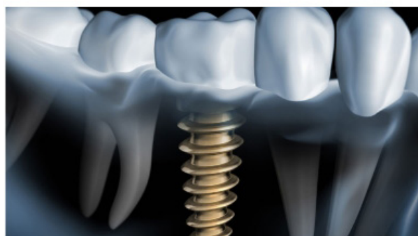
L'implant est une vis en titane totalement bio-compatible. Il remplace la racine d'une dent manquante.